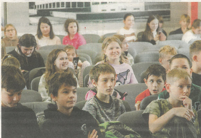
Vážně i nevázně, hlavně ale se zájmem a snahou o nejlepší výsledek.