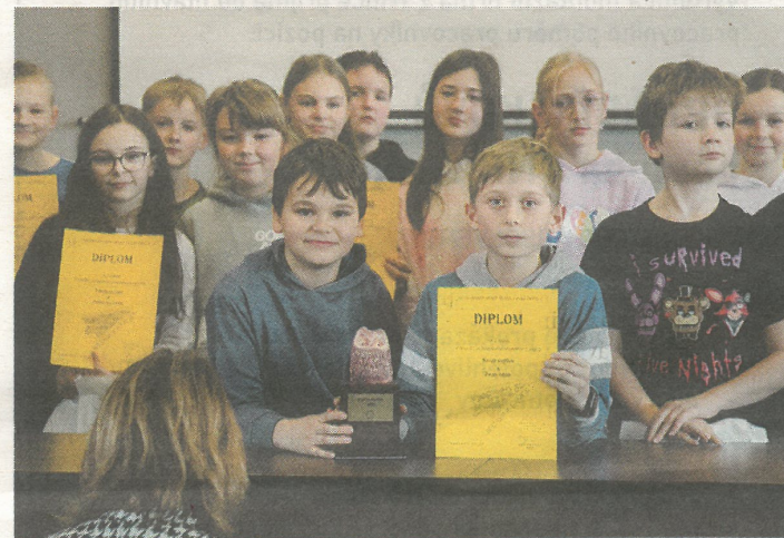
Páťáci dokázali, že otázky financí zvládají bravurně.