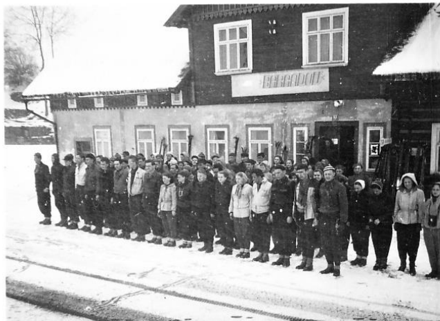
Penzion Barrandov – účastníci zájezdu před penzionem