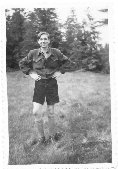
Autor zápisků na třídním výletě na Skalku