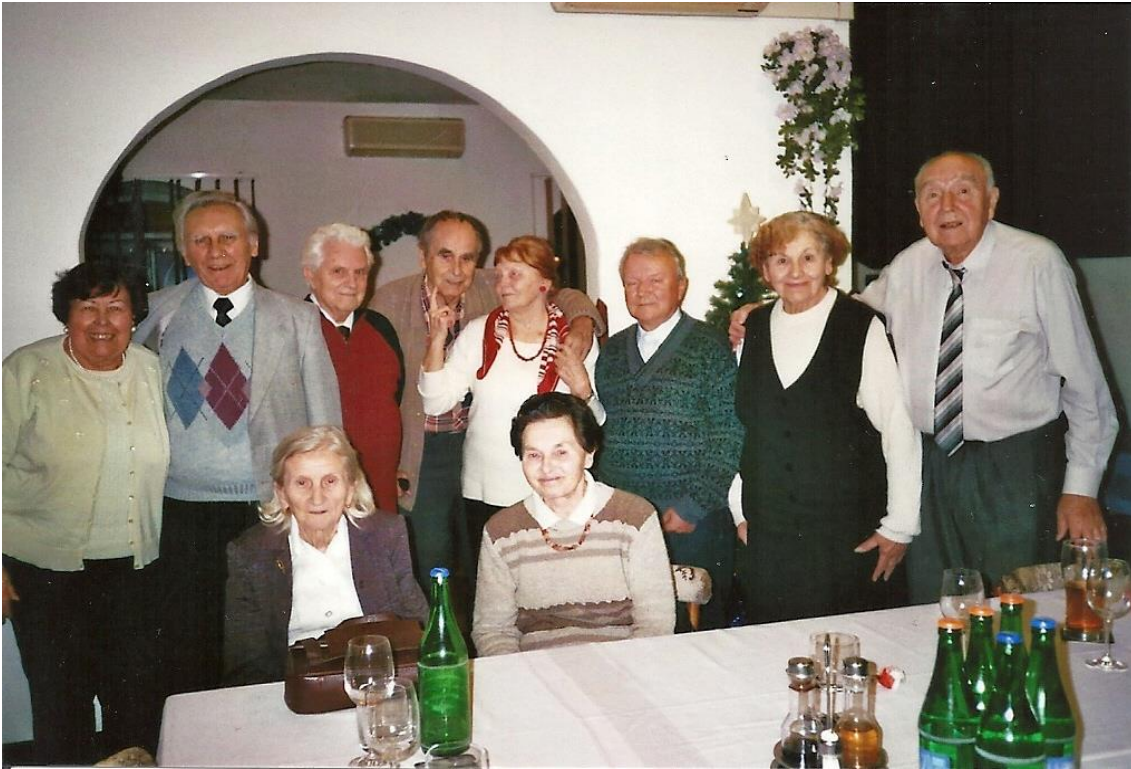
Na srazu po šedesáti letech