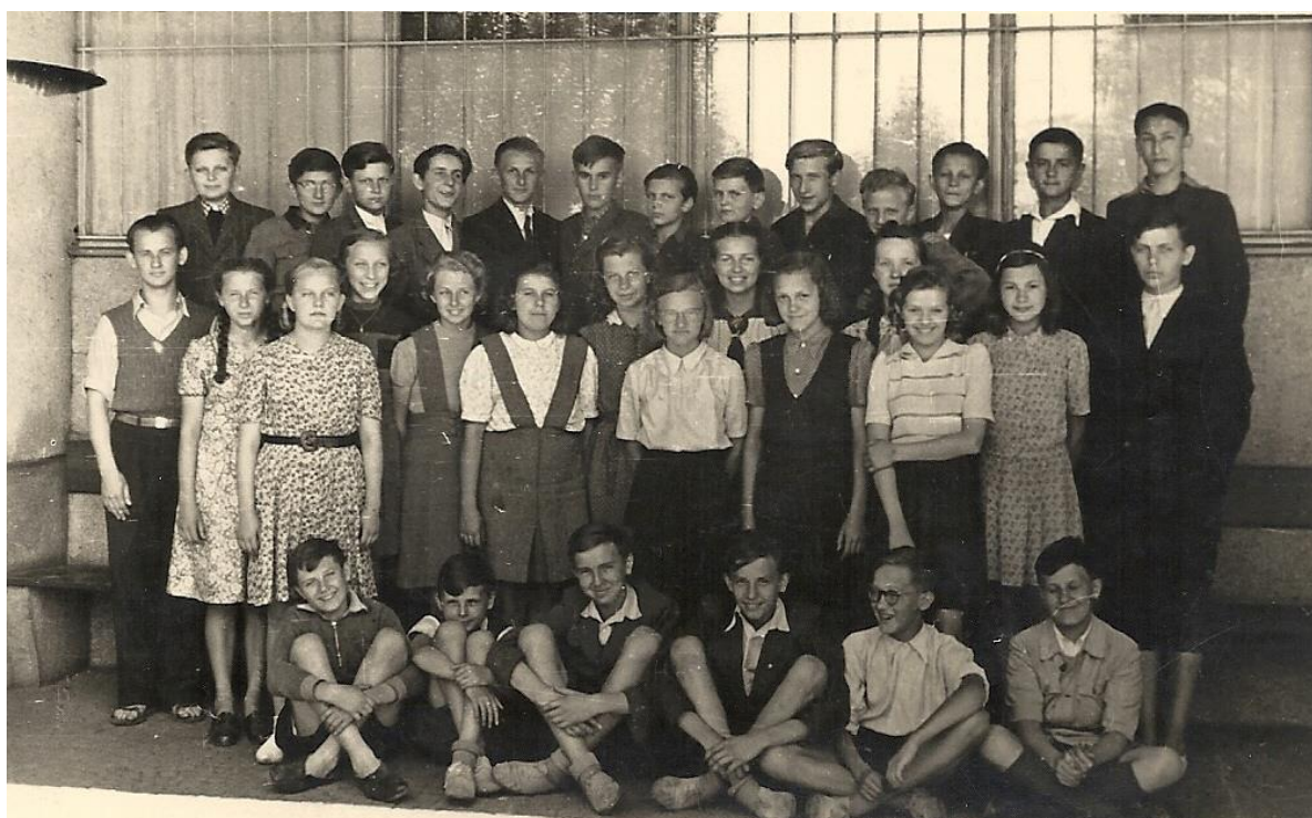
Třída III. A na konci školního roku 1945 – 1946 před budovou gymnázia

Nakonec ještě přání: Ať žije a vzkvétá českotěšínské gymnázium.