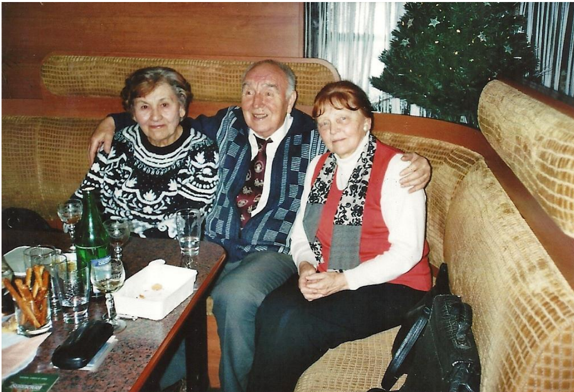
Autor zápisků se svými favoritkami