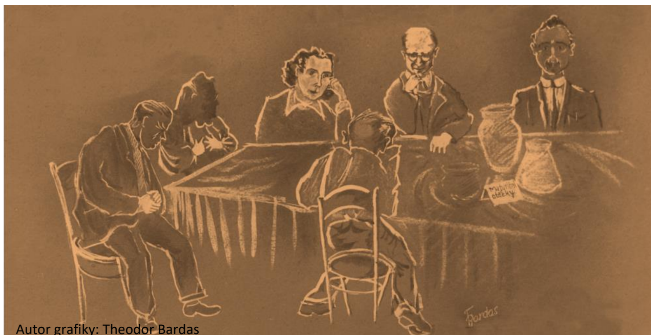
Autor grafiky: Theodor Bardas