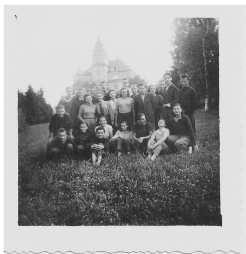
Rekreace ve Vysokém nad Jizerou (Krkonoše) ve dnech 7. – 21. 8. 1949 ve vile doktora Karla Kramáře – tehdy Domu zdraví Zdeňka Fierlingera