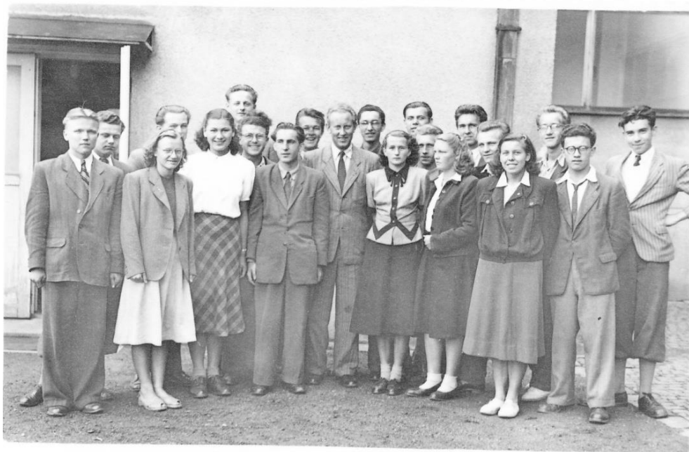
Třída IV. A – neúplná v závěru školního roku 1948/49;