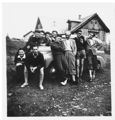
Na Červenohorském sedle