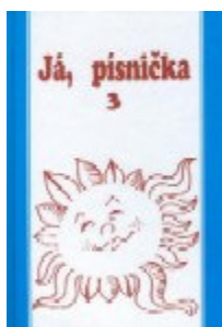
Dvořák V. a kol.: Já, písnička 3, nakladatelství MUSIC CHEB