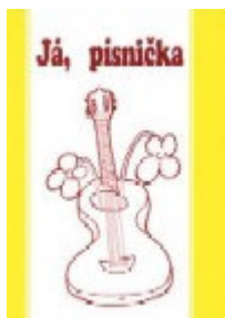
Dvořák V. a kol.: Já, písnička 2, nakladatelství MUSIC CHEB