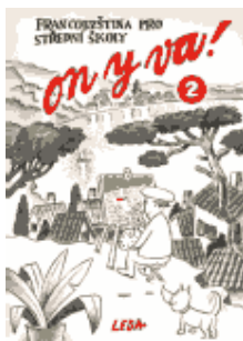
ON Y VA ! 2 (KA,QA, 2., 3. ročník)