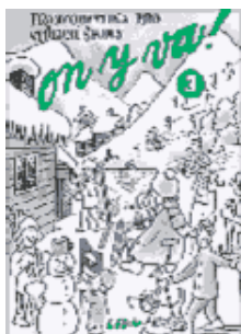
ON Y VA ! 3 (SXA, SPA, OKA, 3., 4. ročník)