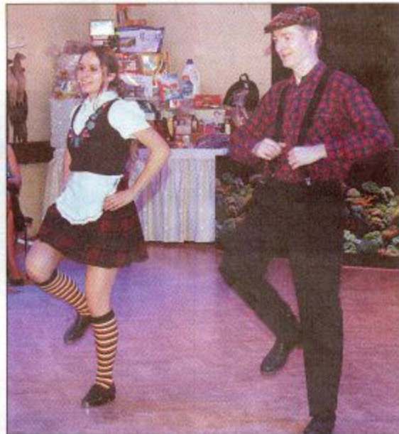
V programu vystoupila skupina Kanafas.